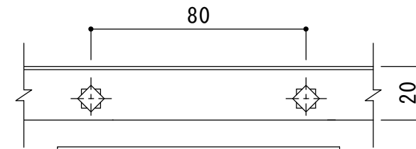
A断面図 S = 1 : 2